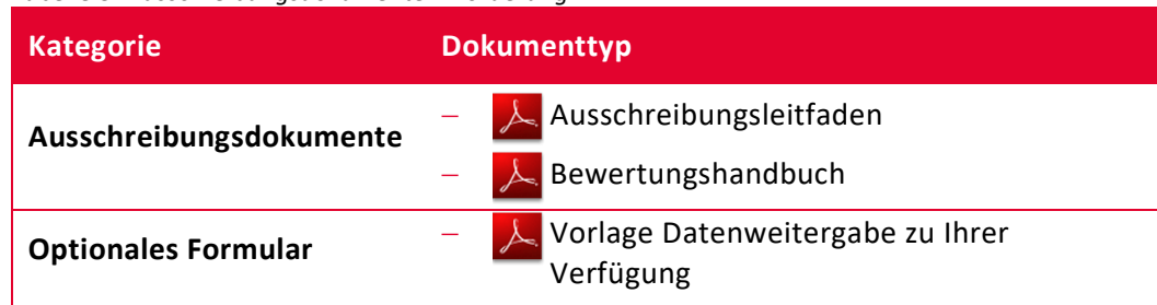
Tabelle 3: Ausschreibungsdokumente – Förderung

Im Rahmen dieser Ausschreibung sind folgende Ausschreibungsdokumente gültig (siehe Ausschreibungswebseite ):