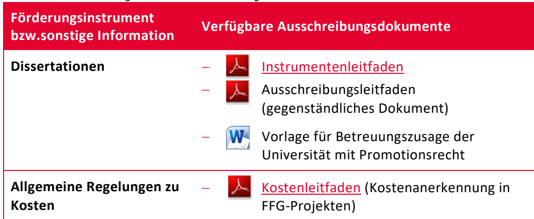
Tabelle 3: Ausschreibungsdokumente – Förderung

Sämtliche relevante Dokumente für die Ausschreibung finden Sie auf der Website .