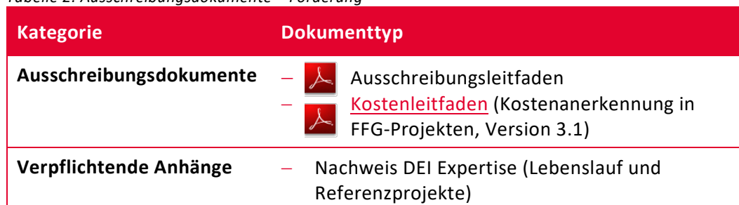
Tabelle 2: Ausschreibungsdokumente – Förderung

Nachfolgende Tabelle listet alle erforderlichen Dokumente für die Einreichung auf. Verwenden Sie die bereitgestellten Vorlagen und Ausschreibungsdokumente im Download Center :