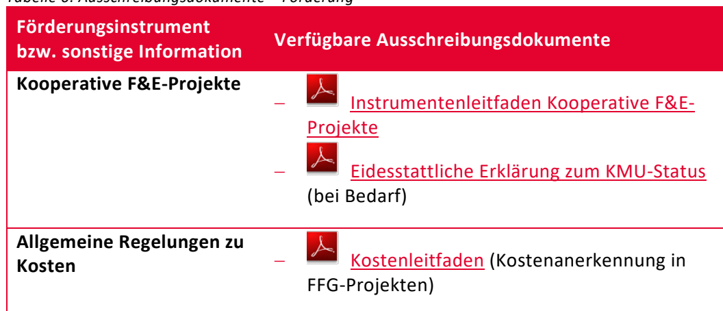
Tabelle 6: Ausschreibungsdokumente – Förderung

Hinweis: Die eidesstattliche Erklärung zum KMU-Status ist für Vereine, Einzelunternehmen und ausländische Unternehmen notwendig. In der zur Verfügung gestellten Vorlage muss – sofern möglich – eine Einstufung der letzten 3 Jahre lt. KMU-Definition vorgenommen werden.