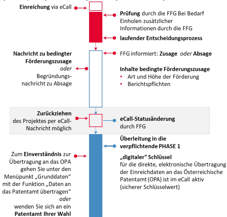
Abbildung 2: Ablauf Antrags- und Förderungsabwicklung bis zur Überleitung in Phase 1

Sie haben eine bedingte Förderungszusage für einen Patent.Scheck erhalten. Für die Abwicklung der Phase 1 wird die gemeinsame Recherche mit einem Patentamt eingeleitet. Der „digitale“ Schlüssel für direkte, elektronische Übertragung der Einreichdaten an das Österreichische Patentamt (OPA) ist jetzt aktiv! Zum Einverständnis zur Übertragung an das OPA gehen Sie unter den Menüpunkt „Grunddaten“ mit der Funktion „Daten an das Patentamt übertragen“ oder wenden Sie sich an ein Patentamt Ihrer Wahl (siehe nachstehende Abbildung 3).