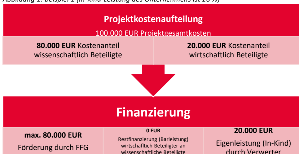
Abbildung 1: Beispiel 1 (In-Kind-Leistung des Unternehmens ist 20 %)

Wenn bei Gesamtkosten von 100.000 EUR die wissenschaftlich Beteiligten 80.000 EUR Kosten haben und die wirtschaftlich Beteiligten 20.000 EUR, so beträgt die Förderung durch die FFG bei ausschließlicher Beteiligung von Kleinen Unternehmen max. 80.000 EUR. Für die eigenen Personal- und Sachleistung erhalten die Unternehmen keine Förderung (siehe Abbildung 1).