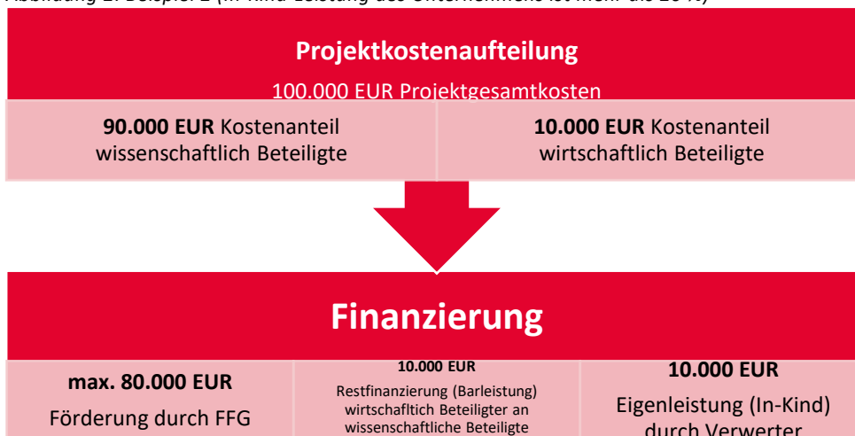
Abbildung 2: Beispiel 2 (In-Kind-Leistung des Unternehmens ist mehr als 20 %)