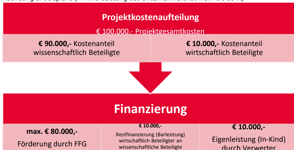
Abbildung 2: Beispiel 2 (In-Kind-Leistung des Unternehmens ist mehr als 20 %)