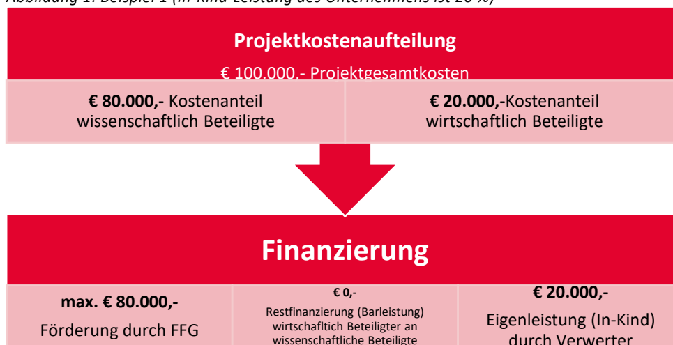
Abbildung 1: Beispiel 1 (In-Kind-Leistung des Unternehmens ist 20 %)

Wenn bei Gesamtkosten von € 100.000,- die wissenschaftlich Beteiligten € 80.000,- Kosten haben und die wirtschaftlich Beteiligten € 20.000,-, so beträgt die Förderung durch die FFG bei ausschließlicher Beteiligung von Kleinen Unternehmen max. € 80.000,-. Für die eigenen Personal- und Sachleistung erhalten die Unternehmen keine Förderung (siehe Abbildung 1).