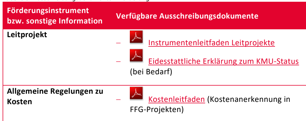
Tabelle 3: Ausschreibungsdokumente – Förderung

Hinweis: Die eidesstattliche Erklärung zum KMU-Status ist für Vereine, Einzelunternehmen und ausländische Unternehmen notwendig. In der zur Verfügung gestellten Vorlage muss – sofern möglich – eine Einstufung der letzten 3 Jahre lt. KMU-Definition vorgenommen werden.