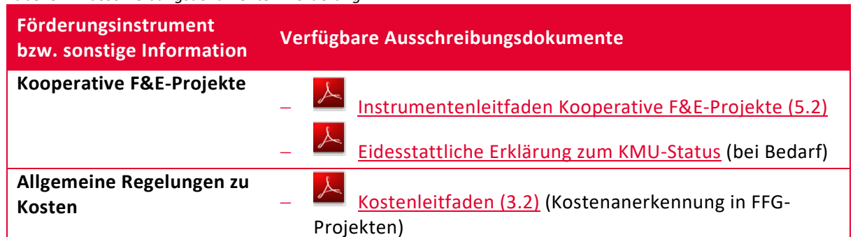
Tabelle 4: Ausschreibungsdokumente – Förderung

Hinweis: Die eidesstattliche Erklärung zum KMU-Status ist für Vereine, Einzelunternehmen und ausländische Unternehmen notwendig. In der zur Verfügung gestellten Vorlage muss – sofern möglich – eine Einstufung der letzten 3 Jahre lt. KMU-Definition vorgenommen werden.